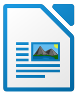
Libre Office Writer

Ce guide est là pour t'aider à organiser ton rapport. Tu auras, par exemple, les différentes parties qui doivent apparaître dans celui-ci et le contenu qui doit y figurer. C'est à toi de faire des phrases et des transitions entre chaque partie. N'oublie pas de te relire (fautes de grammaire, de syntaxe, d'orthographe, ...) et n'hésites pas à aller voir ton enseignant référent si tu as des questions. Tu peux également le contacter via l'outil « Discussion » de Pronote. Cependant, ne t'y prends pas au dernier moment ! N'hésites pas aussi à insérer des objets (images, diagrammes, logos, ...) pour illustrer tes propos.